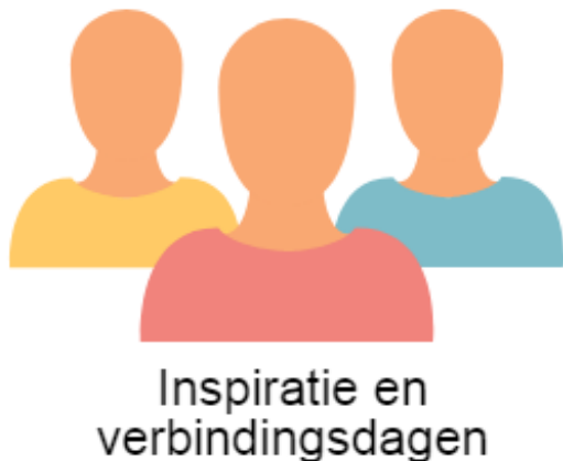
Inspiratie en verbindingsdagen