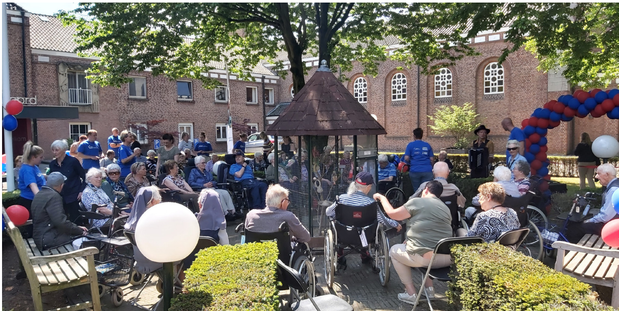
Walk in the Park bij Sint Jozefoord

'Menswaardige aandacht' is onze missie. Aandacht voor alle ouderen, niet alleen de bewoners van Sint Jozefoord of cliënten van de thuiszorg of dagbesteding, maar ook ouderen die eenzaam zijn, of voldoende vitaal voor een bijdrage/rol als vrijwilliger. Het gaat om verbondenheid met de omgeving. Sint Jozefoord is onderdeel van een groter geheel en geeft hiermee invulling aan haar maatschappelijke verantwoordelijkheid.