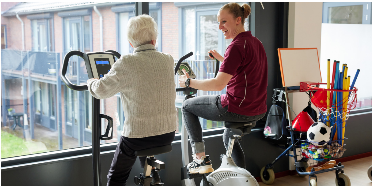
Beweegagoog aan het werk met een van onze bewoners

In 2022 heeft de geestelijk verzorger zich aangesloten bij verschillende teamoverleggen. Daarnaast heeft de geestelijk verzorger een actievere rol gekregen in het MDO.