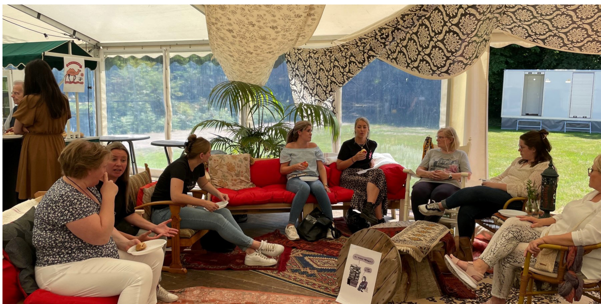
Groet- en Ontmoetdagen 2022

Sint Jozefoord heeft zich ten doel gesteld om het verzuimpercentage in 2022 (6,77%) te reduceren naar 6%. Dit is behaald met een verzuimpercentage van 5,91%. Met dit percentage ligt het verzuim lager dan dat van de branche (9,54%). De meldingsfrequentie is ook licht gereduceerd van 1,46 in 2021 naar 1,41 in 2022. In de branche ligt de meldingsfrequentie op 1,51. Op basis van deze cijfers heeft Sint Jozefoord van de Vernet Health Ranking een cijfer van 8,9 ontvangen. Daarmee zit de organisatie in de top drie van de best presterende organisaties uit de branche.