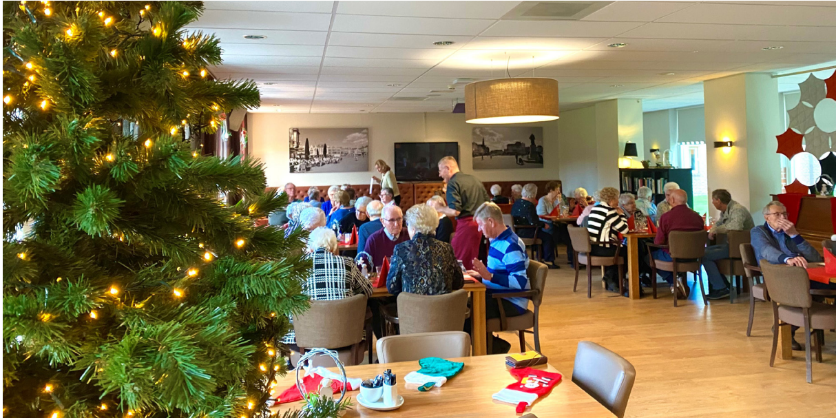
Kerstlunch senioren omgeving