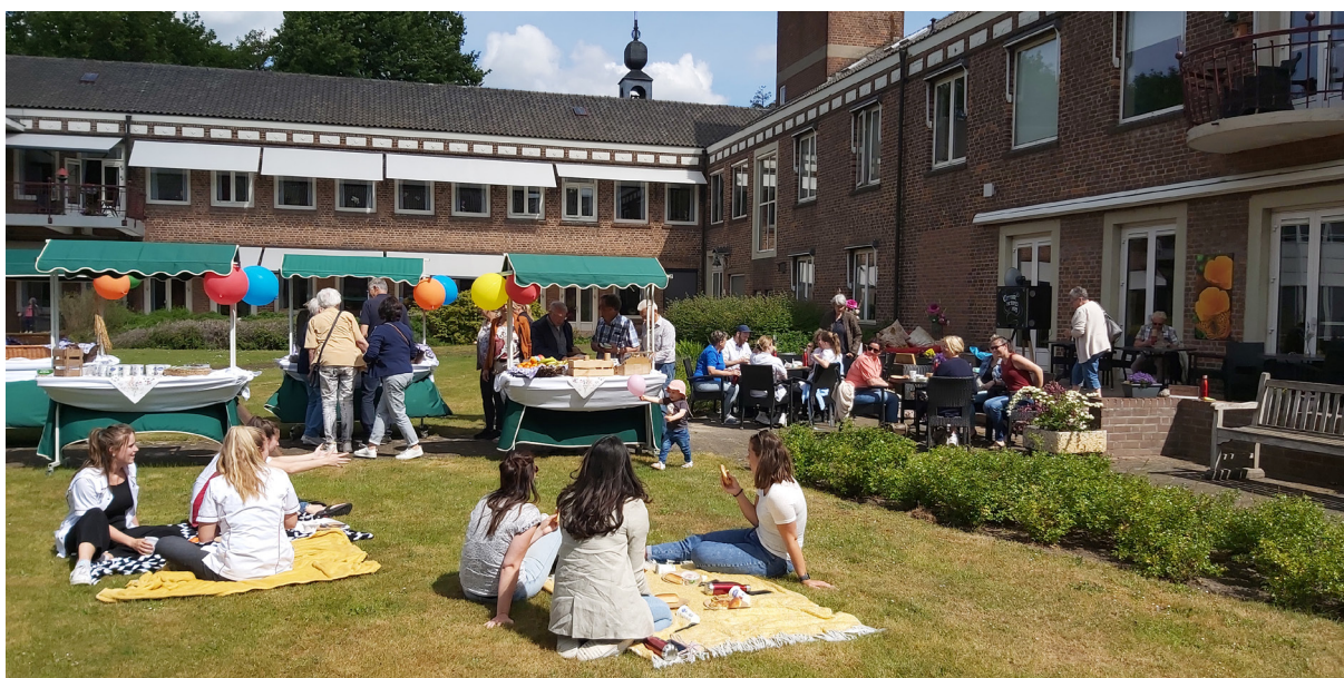
Dag van de verpleging 2022