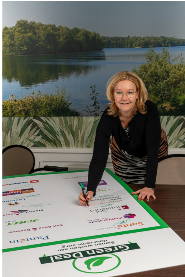
Ondertekening green deal

Sint Jozefoord heeft zich eind 2022 verbonden aan de Green Deal 3.0 en werkt hierin samen met alle VVT-organisaties in Noord Oost Brabant. In 2023 wordt onder begeleiding van een extern adviseur van start gegaan met de thema's Gezondheid (1) en bewustwording (2) , CO2-reductie/verduurzaming vastgoed (3) en tegengaan van verspilling van grondstoffen (4) en medicijnen (5).