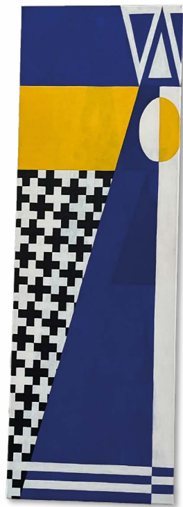
Een van de werken, te zien bij Sint Jozefoord.

Vrijheid van kunst is een politiek of maatschappelijk recht, te vergelijken met de vrijheid van meningsuiting.