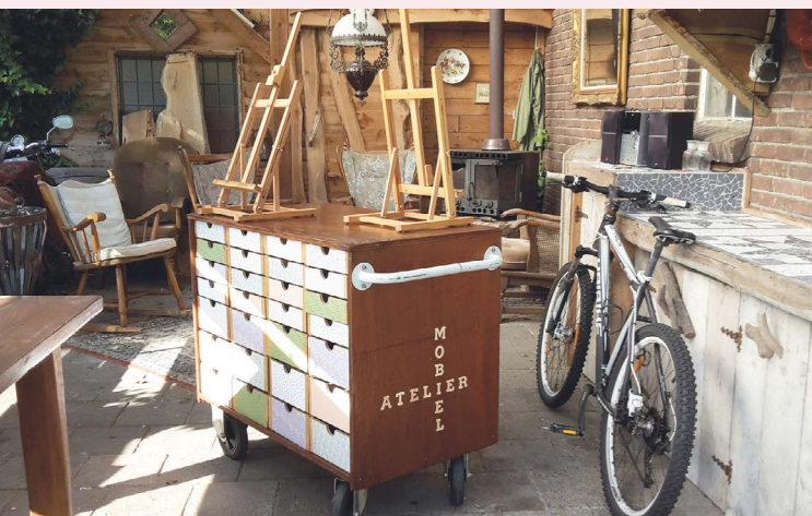
Het mobiele atelier

“Jazeker. Ik werkte als receptioniste bij Sint Jozefoord. Ik schilderde toen al graag en samen met mijn vriendin had ik een expositie bij Sint Jozefoord. Een aantal van die schilderijen hangt nu nog in de gangen: de portretten van de zusters. Ik was zo enthousiast over wat schilderen met mij deed, dat ik de toenmalige bestuurder vroeg of we bij Sint Jozefoord een atelier konden maken. En zo was er twee weken later een atelier in de oude keuken, dat ik helemaal zelf mocht inrichten.