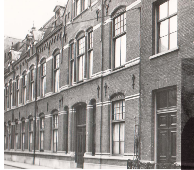
Het Moederhuis aan de Choorstraat in 1900

Er was eens... De oorsprong van Sint Jozefoord lijkt op een sprookje. We gaan terug naar 's-Hertogenbosch in de 19de eeuw. Een middeleeuws ogende stad met smalle steegjes, brede grachten, bastions en hoge wallen. Stel je het geluid voor van hoefslagen, handkarren en ruik daarbij de geur van bierbrouwerijen. Volop handel en levendigheid.