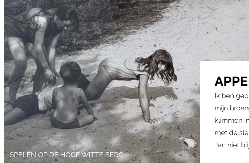
SPELEN OP DE HOGE WITTE BERG

en ondersteunen. Zo blijft Sint Jozefoord ook de komende jaren doen waar we al 75 jaar voor staan: samen zorgen voor een mooie dag.