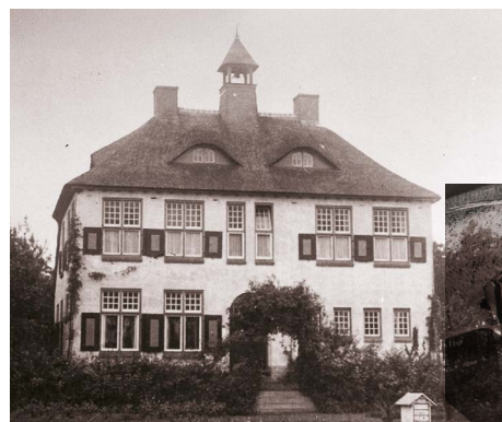
Landgoed Duyn en Dael